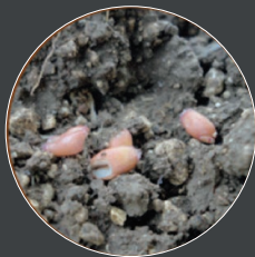
Semis en conditions humides