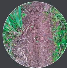
Semis sous couvert, Strip till