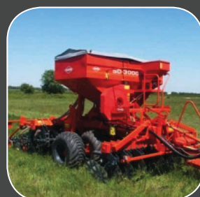
Incorporation dans la tête de distribution du semoir