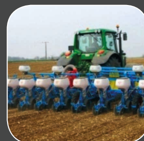
Arrivée de l'anti-limaces dans l'élément semeur