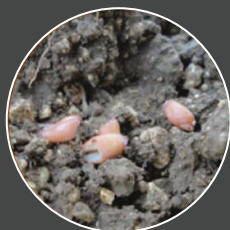
Semis en conditions humides