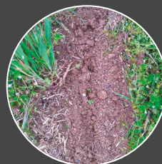
Semis sous couvert, Strip till