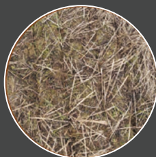
Raie de semis non refermée